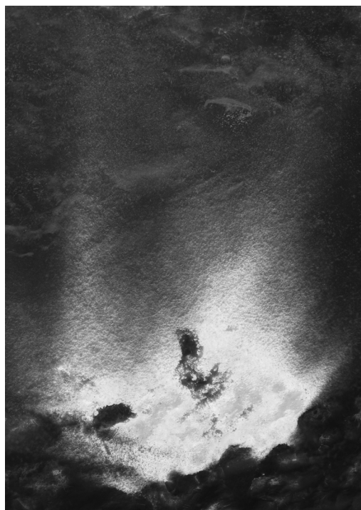
Aska & Snö av Anne Appelblad